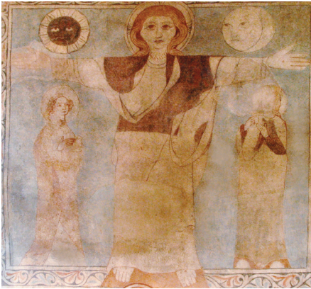
Der gekreuzigte und auferstandene Christus umfasst mit seinen Armen die ganze Welt.