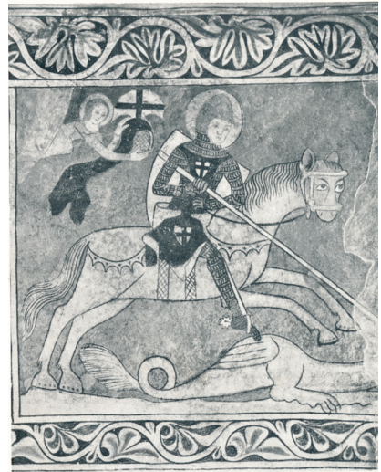
Oben: Der hl. Georg im Kampf mit dem Drachen.