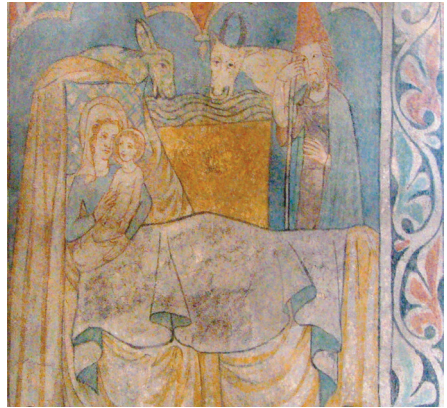
Weihnachtsdarstellung, Maria im Wochenbett, das Kind nicht in einer Krippe. Chor-Südwand.